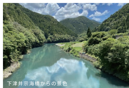
下津井宗海橋からの景色

私 が高知県への移住を決めたきっかけは、大学生時代まで遡ります。私が通っていた大学は高知工科大学で、4年の間に高知の食・自然・人が大好きになりました。特に、当時所属していた天文部では、高知県の各地に赴いて小学生対象に天文イベントを開催していたため、イベントを通して地元の方々に触れる機会が多く、高知県特有の人の明るさに惹かれました。