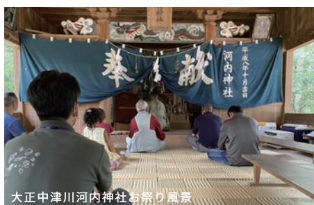
大正中津川河内神社お祭り風景