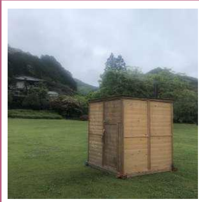
♡ 817 RIVER FESTA 2022