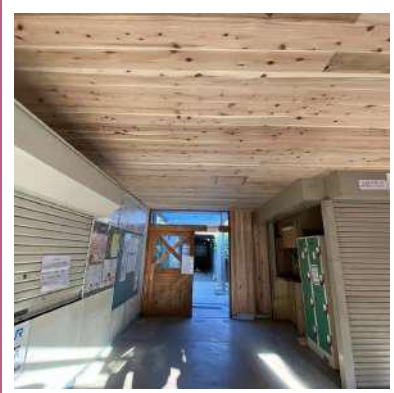
♡ 951 土佐大正駅を DIY